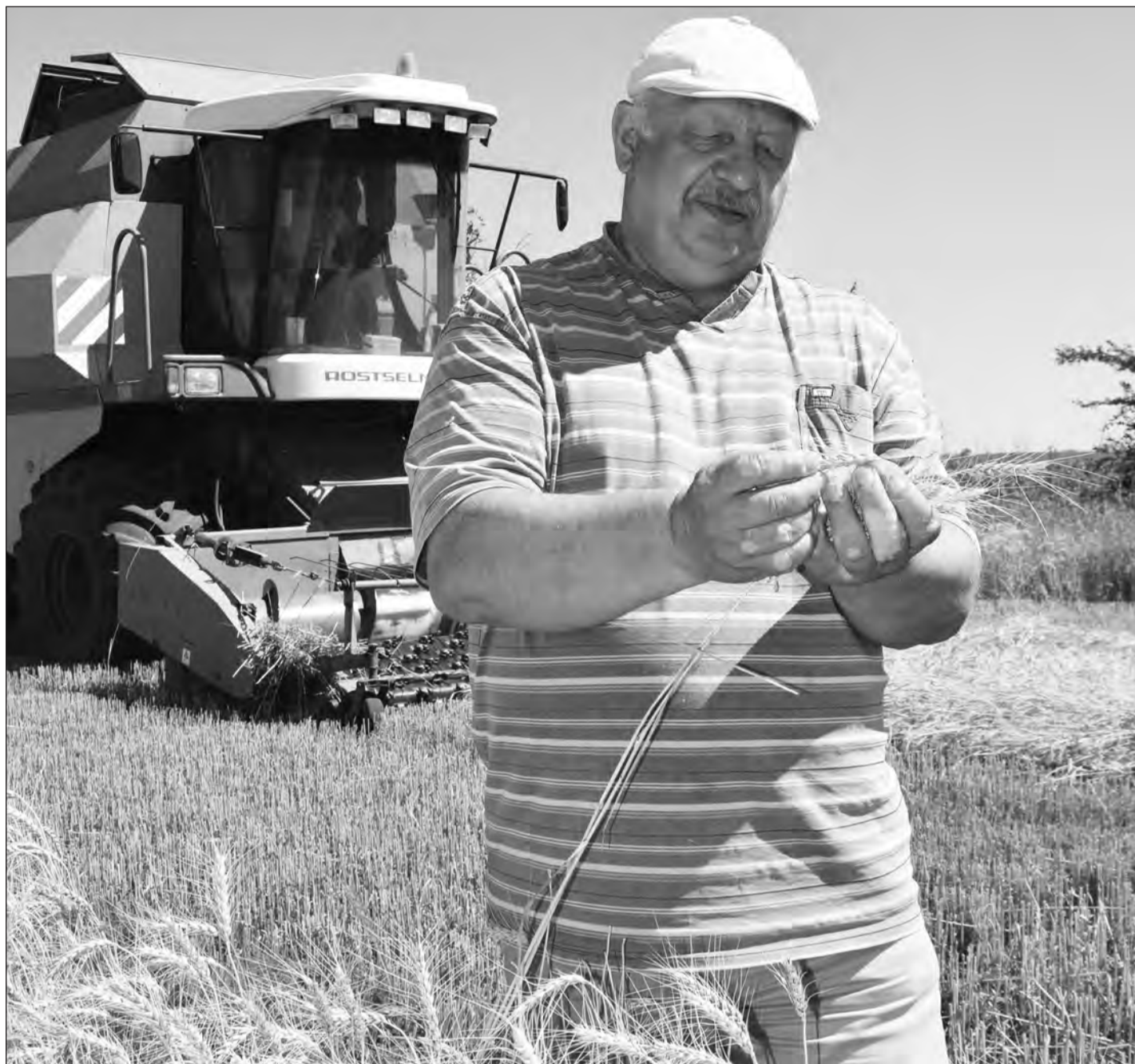
■ Колос налился, пора выводить комбайны

Всего сейчас в КФХ содержится около 2200 голов крупного рогатого скота.