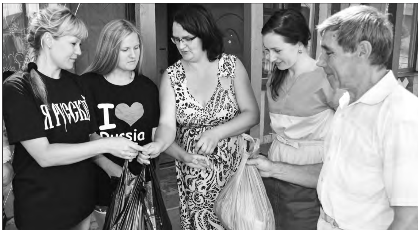
Гуманитарный груз передан по назначению

Беженцы с Украины нуждаются в нашей помощи