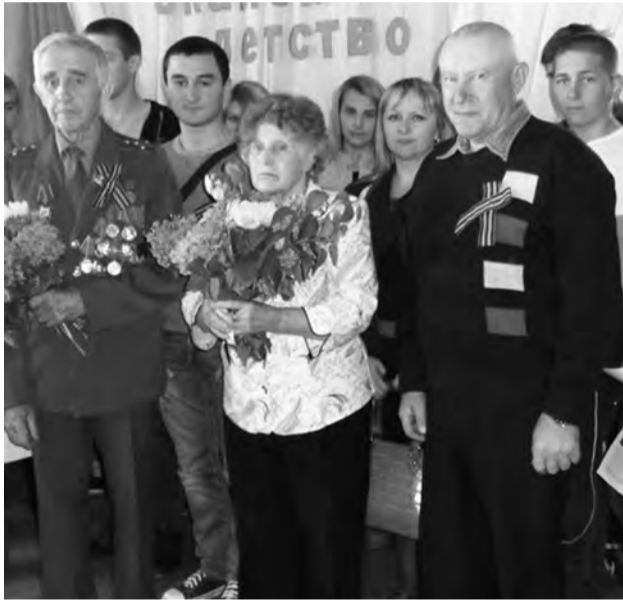
■ Ветеранам особое внимание

– Берегите мир и цените то, что для вас завоевано вашими прадедами, – такой наказ дали молодежи ветераны.