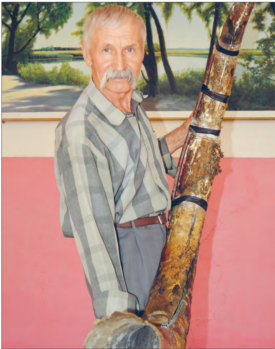
Уникальный экспонат увидеть сегодня сможет любой посетитель Дубравского музея