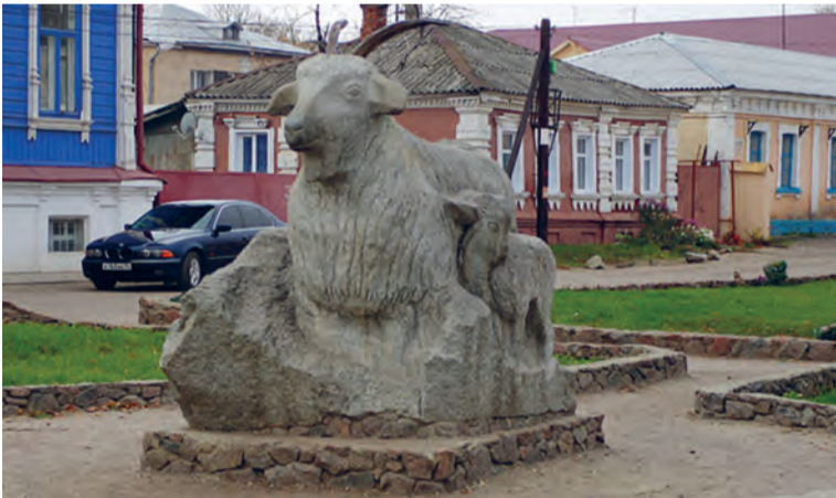
■ Памятник козы, исполняющей желания