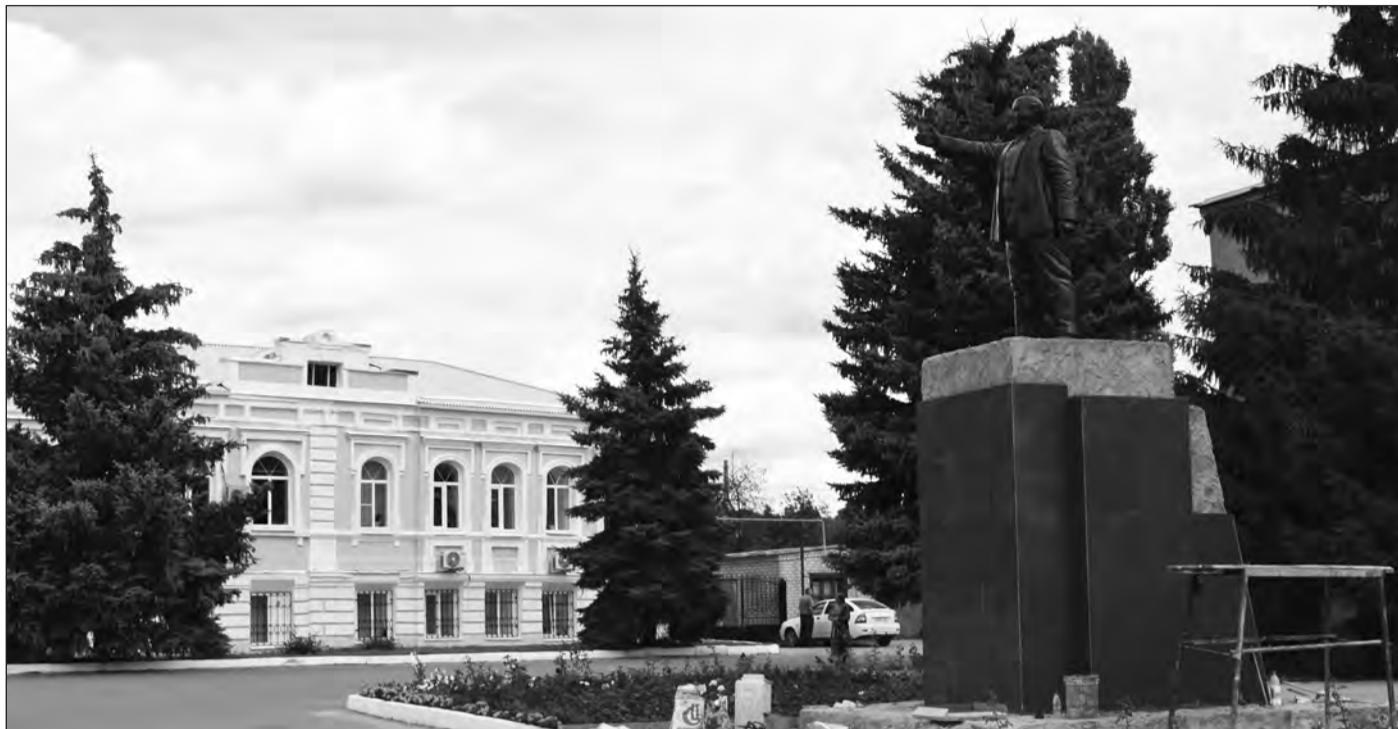
■ В центре города вовсю идут работы по благоустройству

О своих штрафах богучарцы могут узнать на www.36.gibdd.ru .