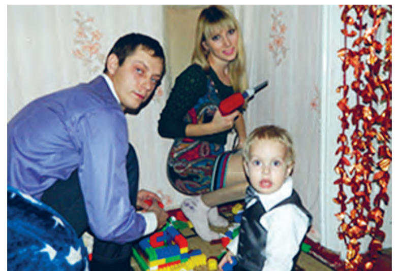
■ Семья Костенко любит проводить время вместе